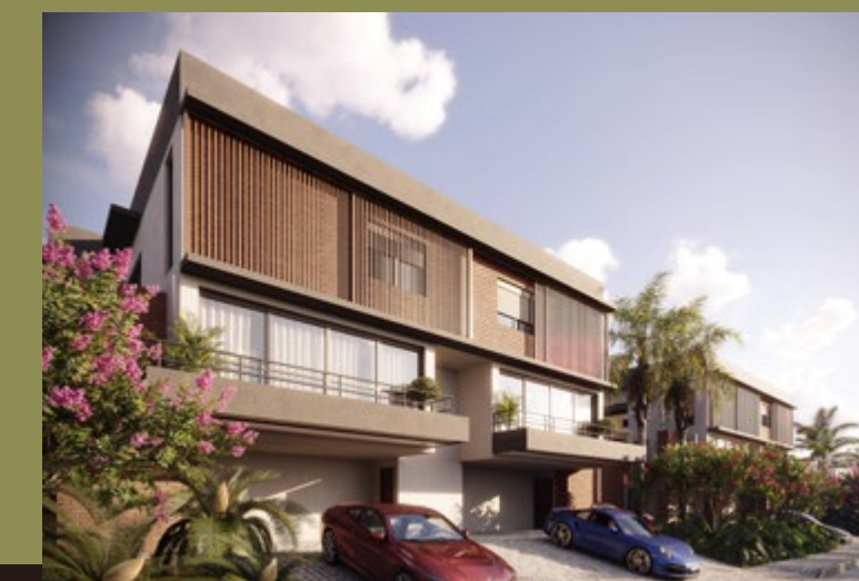
VILLAGE SAINTE HÉLÈNE