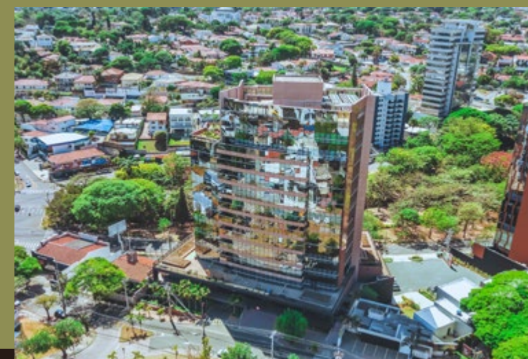
575 NORTE SUL