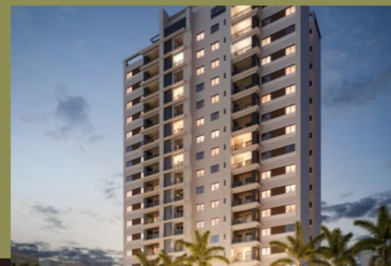
ECO VILA PRIMAVERA