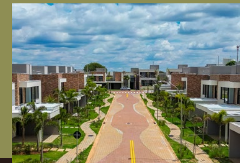
RESERVA ALPHA GALLERIA